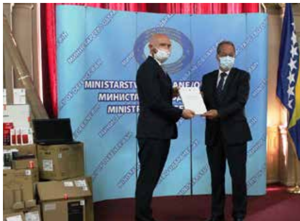
Donacija opreme Generalnom inspektoratu MO BiH i pomoć u izradi Rodne analize OS BiH, 9. juni 2020. godine, Dom OS BiH, Sarajevo

Tom prilikom, ambasador Field je naglasio da je „Ured generalnog inspektora odgovoran za borbu protiv korupcije i izgradnju integriteta, te djeluje kao savjetodavno tijelo za pripadnike i pripadnice Oružanih snaga BiH. U ovim teškim vremenima, ovo je posebno važno i zaista mi je drago što možemo pomoći rad Generalnog inspektorata. Oprema