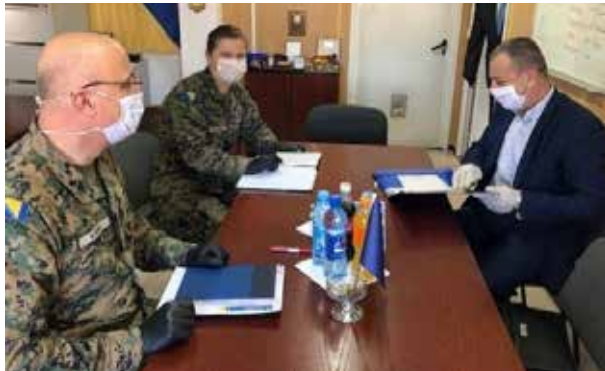
Radna posjeta parlamentarnog vojnog povjerenika BiH Generalnom inspektoratu MO BiH, 2. april 2020. godine

Parlamentarni vojni povjerenik i GI MO BiH redovno vrše posjete komandama i jedinicama, te zajednički rade na određenom broju predmeta, što na godišnjem nivou iznosi oko 20 predmeta.