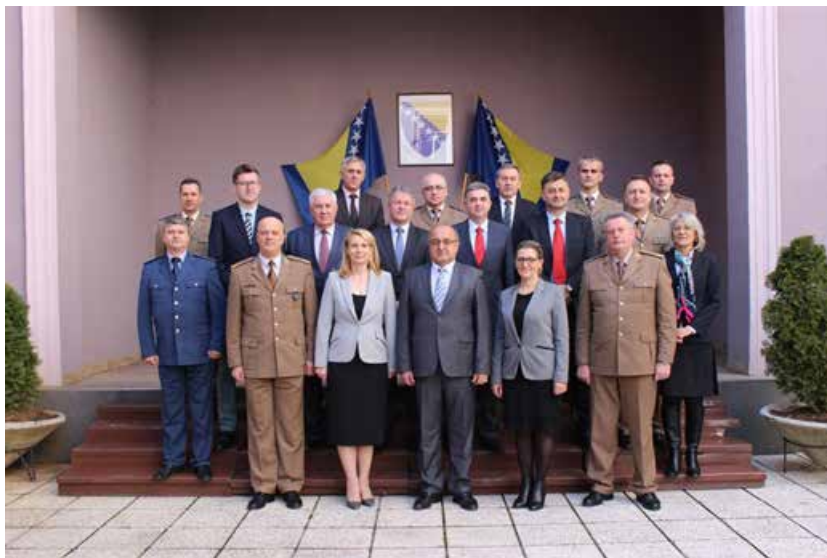
Analiza realiziranih mjera po preporukama NATO Ekspertnog tima za izgradnju integriteta, 28. februar 2019. godine, Dom OS BiH, Sarajevo

Prilikom analize realiziranih mjera po preporukama NATO-ovog Ekspertnog tima za izgradnju integriteta, predstavnica NATO-a iz Brisela dr. Nadia Milanova izrazila je zadovoljstvo napretkom MO BiH od 2014. u procesima koji vode ka jačanju integriteta, povećanju transparentnosti, ali i efikasnosti MO i OS BiH. Posebno je istakla značaj i ulogu PSOTC-a u BiH kao partnerskog centra za obuku i edukaciju koji kroz svoje programe ima važnu ulogu za OS BiH, ali i za druge države.