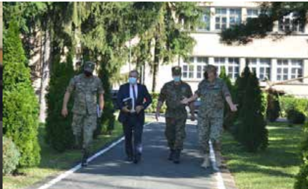
Radna posjeta parlamentarnog vojnog povjerenika BiH i generalnog inspektora MO BiH inženjerskom bataljonu, 26. august 2020. godine, kasarna „Zdravko Čelar“, Derventa