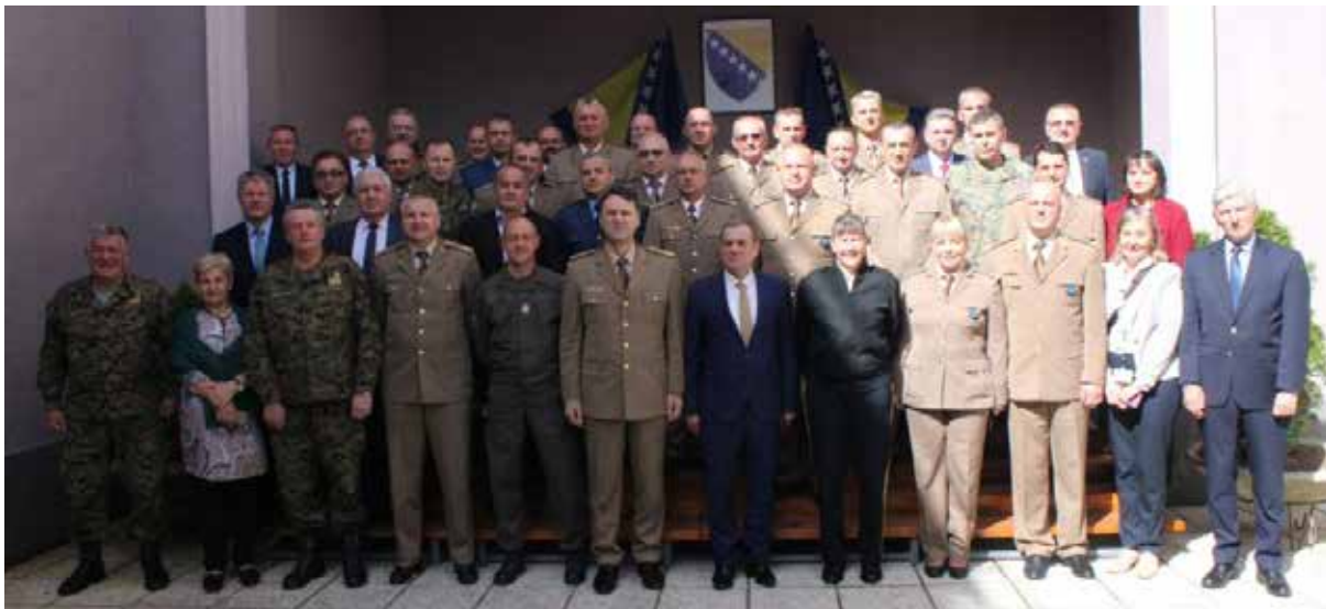
13. konferencija Generalnog inspektorata MO BiH i inspektora u OS BiH, 24. april 2019. godine, Dom OS BiH, Sarajevo

Posebno je značajan angažman Generalnog inspektorata na iniciranju i davanju preporuka za poboljšanje određenih propisa od značaja za Oružane snage i Ministarstvo odbrane. Prethodno iskustvo nam govori da su mnogi problemi otklonjeni i da su određena pitanja bolje regulirana nego što je to bilo ranije. Generalni inspektorat je u prethodnom periodu opravdao svoje postojanje i značajno doprinijelo unapređenju stanja u Oružanim snagama.“