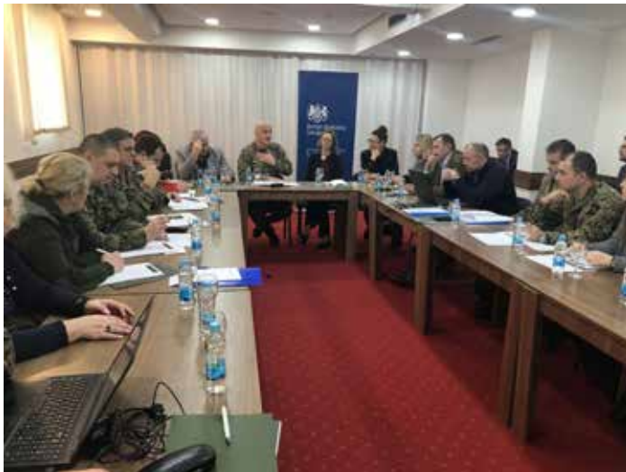
Radionica o implementaciji zaključaka konferencije Mreže načelnika štabova – „Žene, mir i sigurnost“, 27 - 30. januar 2020. godine, Banja Luka

U cilju podizanja kompetencija, inspektori su educirani u zemlji i inostranstvu. Kada je u pitanju funkcionalna edukacija inspektora, posebnu važnost pridajemo usavršavanju po Programu IMET (eng. - International Military Education and Training (IMET) ), odnosno Kursu za generalne inspektore u SAD-u, na kojem se jednom godišnje educiraju inspektori iz sistema inspektora MO i OS BiH, kao i obuku u oblasti jačanja integriteta koja se organizira od strane NATO-a i Ujedinjenog Kraljevstva.