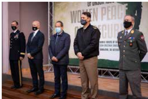
20. godišnjica Rezolucije Vijeća sigurnosti UN 1325 „Žene, mir i sigurnost“, 30. oktobar 2020. godine, Dom OS BiH, Sarajevo

Na osnovu ovog projekta, po prvi put u okviru ove mreže je u martu 2019. godine održana konferencija „Žene, mir i sigurnost“ čiji je domaćin bio načelnik Zajedničkog štaba OS BiH generalpukovnik Senad Mašović.