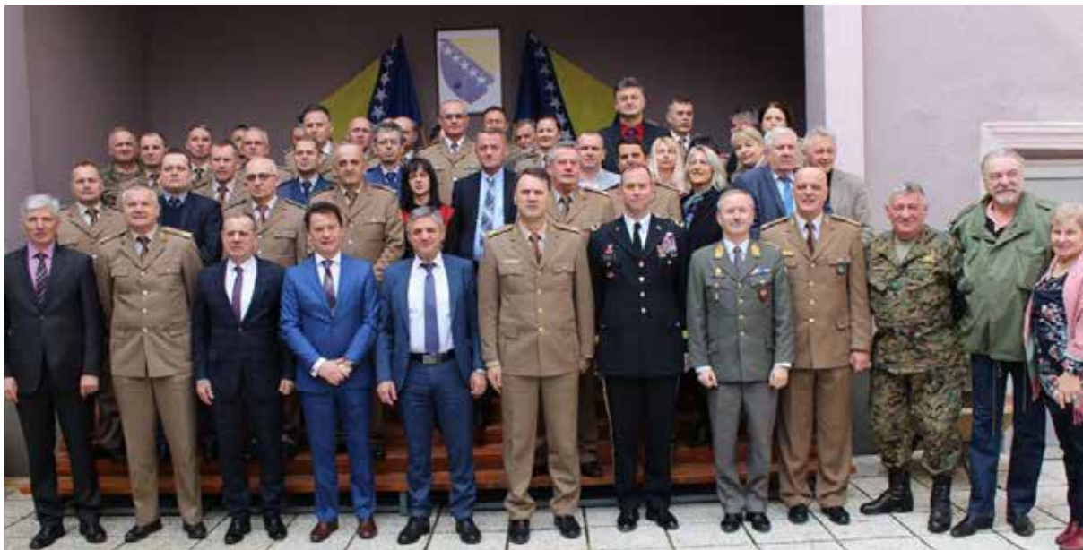
14. konferencija Generalnog inspektorata MO BiH i inspektora u OS BiH, 11. mart 2020. godine, Dom OS BiH, Sarajevo

Shvatio sam da mogu učiniti neke stvari za mene i za moju komandu. Tražio sam da mi pomognu da vidim neke aspekte problema koje meni kao komandantu nije bilo lako vidjeti. Saznao sam da je korisno s vremena na vrijeme konsultirati inspektora o potencijalno kontroverznim i teškim odlukama koje moram donijeti, a vezanih za pitanja kojima sam se bavio. I to sam radio prije nego što je problem postao problem. Saznao sam zapravo da inspektor želi upravo ono što komandanti na svim nivoima žele. Oni žele da njihove jedinice budu najbolje jedinice u OS.