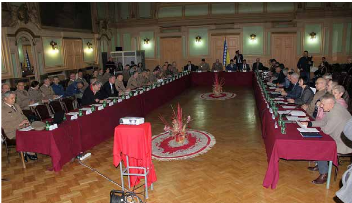
14. konferencija Generalnog inspektorata MO BiH i inspektora u OS BiH, 11. mart 2020. godine, Dom OS BiH, Sarajevo

Na 14. konferenciji Generalnog inspektorata MO BiH i inspektora u OS BiH, komandant NATO Štaba u Sarajevu brigadni general William J. Edwards i komandant EUFOR-a generalmajor Reinhard Trischak izjavili su: