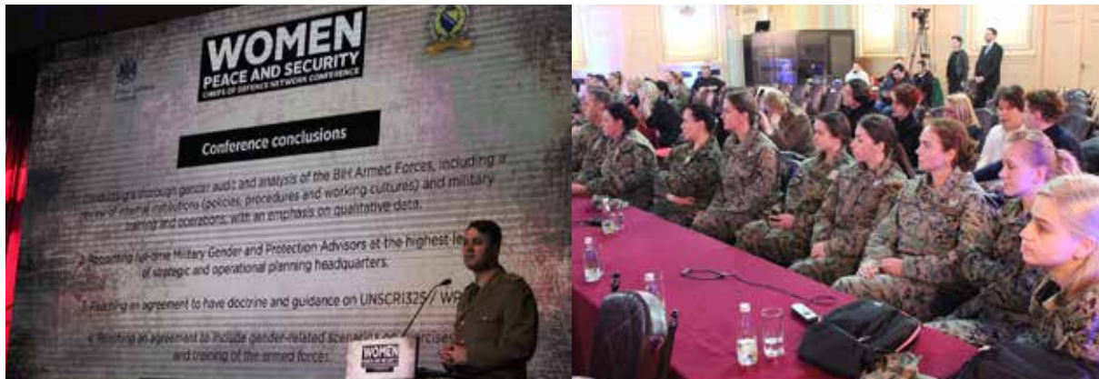
Regionalna konferencija „Žene, mir i sigurnost“ u okviru Mreže načelnika generalštabova, 8. mart 2019. godine, Dom OS BiH, Sarajevo

U oblasti rodne ravnopravnosti, MO i OS BiH su se pridružili projektu Mreže načelnika štabova „Žene, mir i sigurnost“ (WPS CHODs Network).