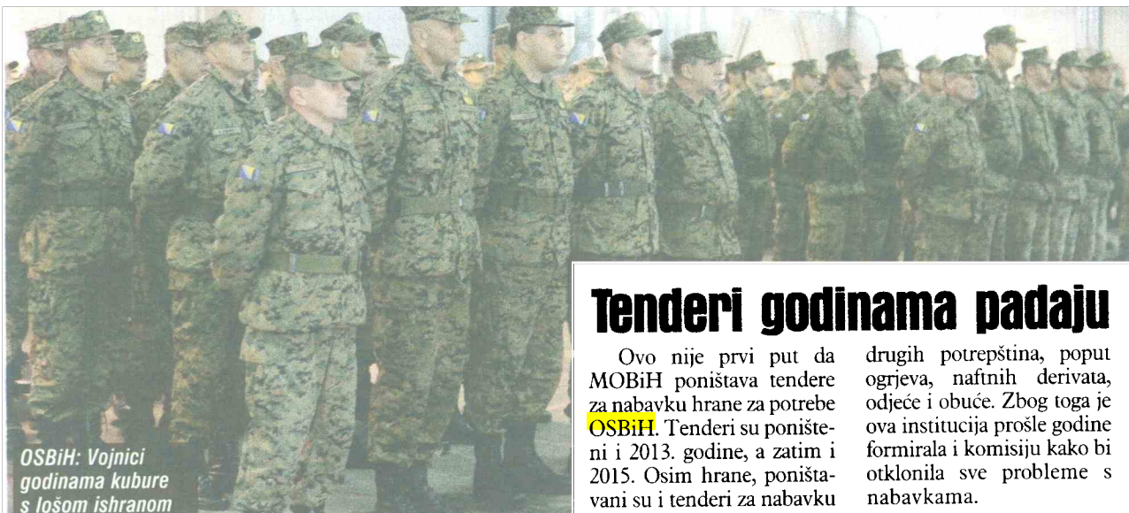
OSBiH: Vojnici godinama kubure s lošom ishranom